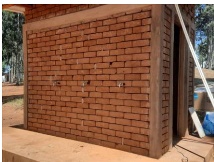
Gebäude mit Trinkwasserhähnen

Die Versorgung der Krankenstation mit Trinkwasser war problematisch. Nach einer erfolglosen Tiefenbohrung, wird seit dem Sommer 2025 Wasser aus dem Uferbereich eines Flusses gepumpt, in einem Wassertank gespeichert und dann mit einer Anlage von aqua pura aufbereitet. Dieses wurde vom Staat geprüft und als Trinkwasser klassiert.