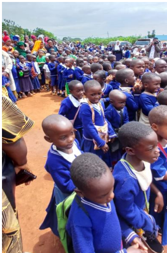
Fest der Inbetriebnahme der Trinkwasseranlage

Die Nshamba Schule mit bis zu 1'000 Kindern im Schichtbetrieb, ist einige Kilometer von der Krankenstation der Maisha Mema Foundation entfernt. Seit längerer Zeit wird die Schule von engagierten Personen aus der Schweiz unterstützt, woraus sich eine Zusammenarbeit mit der Maisha Mema Foundation entwickelt hat. Da auch in dieser Schule Trinkwasser nur in schlechter Qualität zur Verfügung stand, konnten im Sommer 2025 mit Begleitung durch Maisha Mema für die Schule zwei aqua pura Aufbereitungsanlagen installiert werden. Die Anlagen werden von der Krankenstation aus betreut.