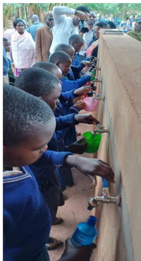
Erster Bezug vom Wasserhahn