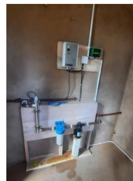
Wasser Aufbereitungsanlage im Innern des Gebäudes